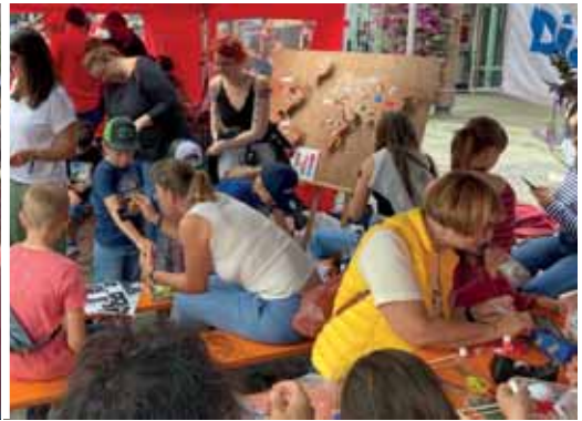
v.l.: 100 Kerzen, 100 Erinnerungen; Überblick „Aschaffenburg ist bunt“, Stand des Jugendzentrums